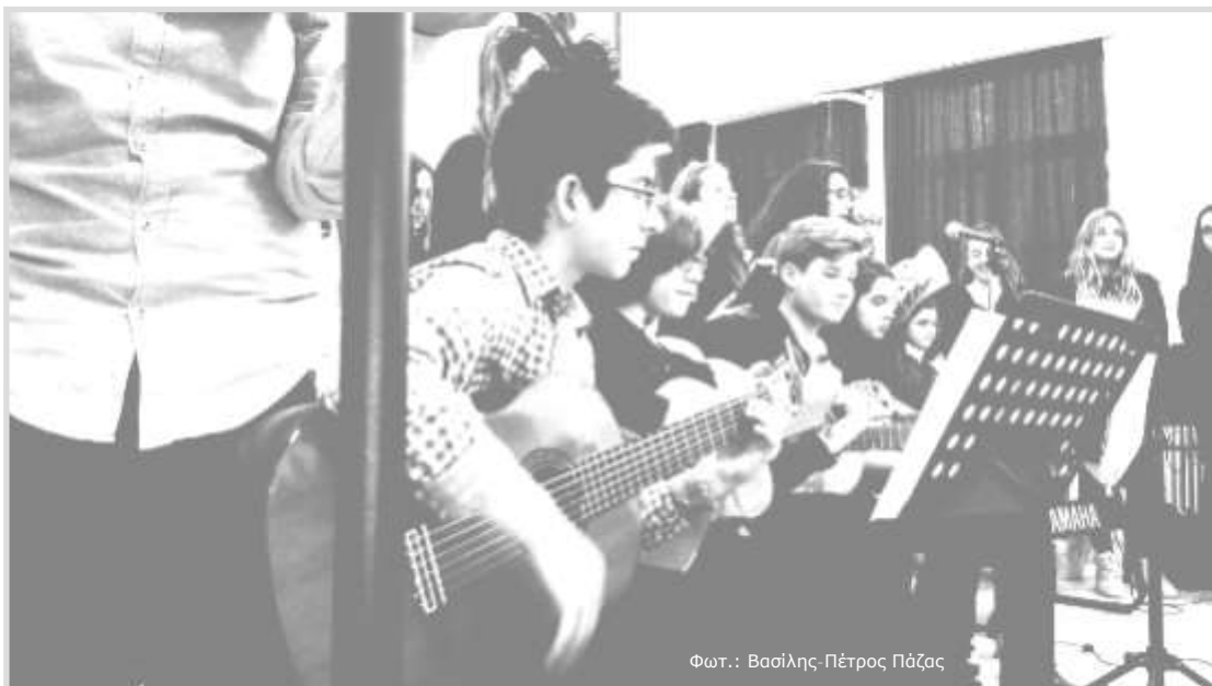
Φωτ.: Βασίλης Πέτρος Πάζας